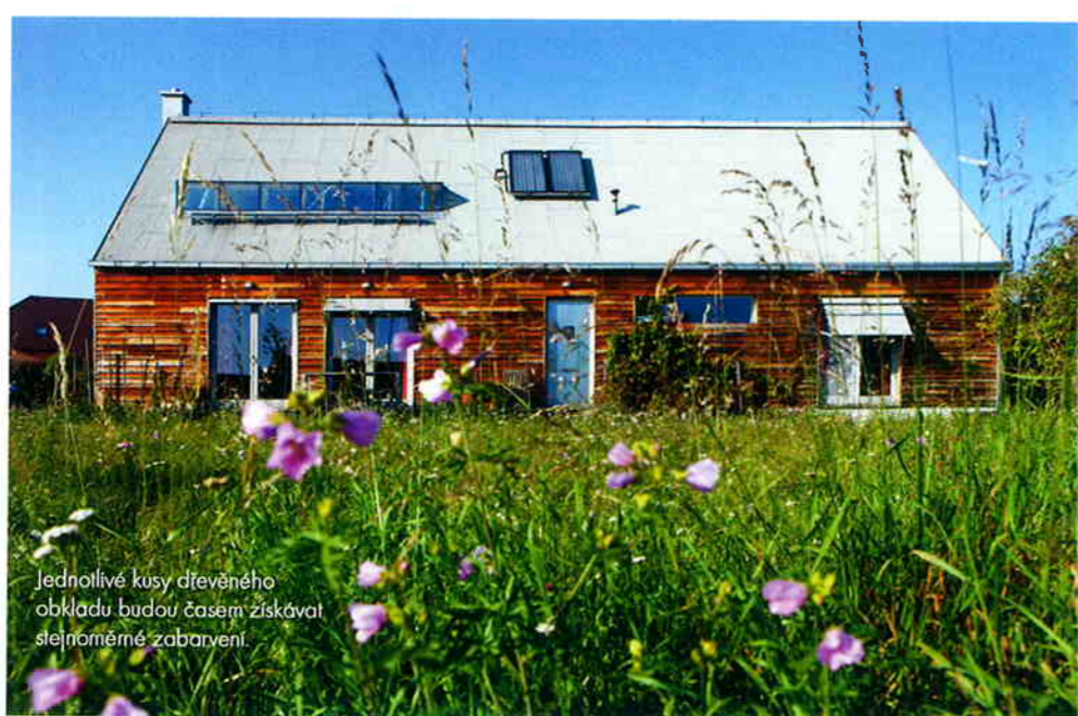
Jednotlivé kusy dřevěného obkladu budou časem získávat stejnoměrné zbarvení.

Podlahová plocha: 180 m 2 Počet členů rodiny: 4 Konstrukce: tvárnice suchého zdiva, dřevo Použité materiály: tvárnice, smrkové dřevo, tropické dřevo - odpad Způsob vytápění: plynový kotel a solární panely pro ohřev TUV