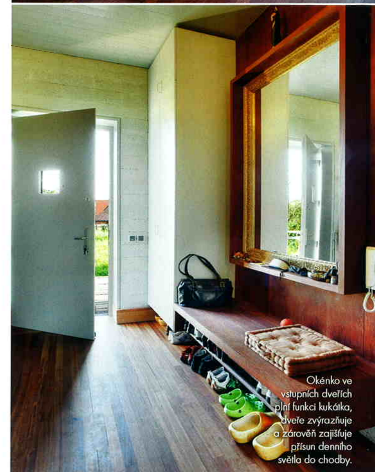
Okénko ve vstupních dveřích plní funkci kukátka, dříve zvyrazňuje a zároveň zajišťuje přísun denního světla do chodby.