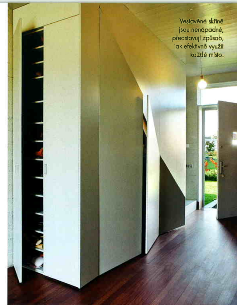
Vestavěné skříně jsou nenápadné, představují způsob, jak efektivně využít každé místo.

Inspirace někdejšími lidovými stavbami je zde patrná v členění vnitřních prostor domu. K trávení společných chvil čtyřčlenné rodiny slouží velkorysý obytný prostor v přízemí, od intimní části domu, kde se nacházejí ložnice a hygienické místnosti (dvě koupelny a WC s umyvadlem), jej odděluje středová průchozí chodba. Půdní prostor pod šikmou střechou, jež byla požadována místní regulací, byl zpočátku zamýšlen jako úložný a ponechán osudu pro případ, že by se objevily potřeby, které přízemní část domu nemůže uspokojit. Časem se jeho úkol našel, dnes má v části prostoru pod střechou majitel domu velkorysou pracovnu. Vstoupit se do ní dá jak zevnitř domu pomocí vyklápěcích „dveří“, tak zvenčí po schodišti.