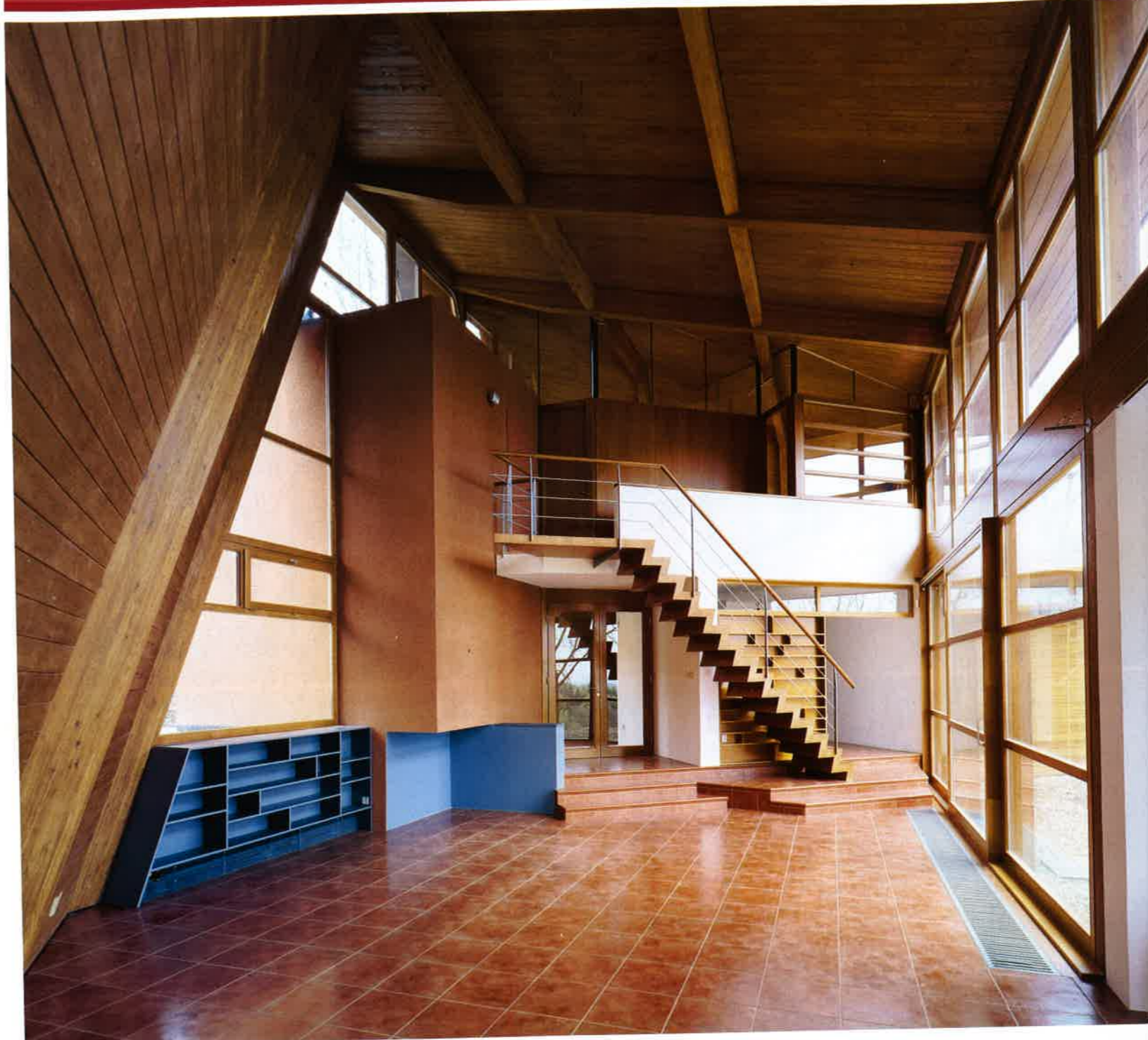
Hlavní obytný prostor v přízemí. Smrkové obložení lakýrníci namořili tak, aby připomínalo modřín. Jednoramenným schodištěm se návštěvník dostane do prvního patra